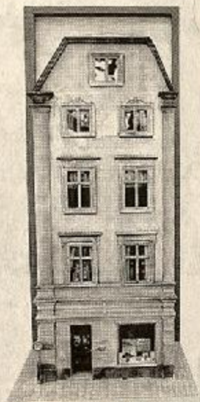
Stora Nygatan 23.